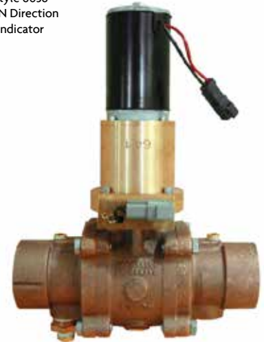
Optional high speed valve provides pulses between 1/2 second - 2 1/2 seconds in length or can be used in continuous mode.