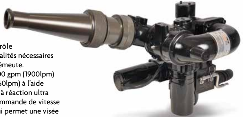
STYLE 3563 Shown with STYLE 489 Tip & 3485 Stream Shaper